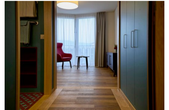
Die hochwertige Materialisierung und das Farbkonzept im Innern überzeugen.

jedes Zimmer eine zusätzliche Ecke und weicht damit vom klassisch-rechteckigen Altersheim-Stil ab. Innen wurden schöne und warme Materialien verwendet. Und nostalgische: So wurden etwa verschiedene Türzargen aus Schwarznussbaumholz gefertigt, das von zwei Bäumen stammt, welche dem Neubau weichen mussten. Ganz fertig sind die Arbeiten noch nicht: In zwei Wochen findet der grosse Umzug aus dem alten Pflegeheim statt.