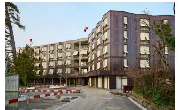
Der Neubau des Pflegeheims ist auberginefarben.